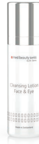
med beauty swiss Cleansing Lotion Face & Eye

Jedes Konzentrat erfüllt seinen eigenen Zweck gezielter Anti-Aging-Strategie oder Hautbildverbesserung: schützend, beruhigend, straffend, stärkend oder regenerierend. Die Konzentrate können als Kur oder ergänzend zur Hautpflege und -situation eingesetzt werden.