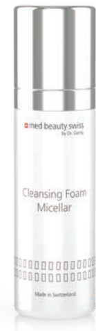
med beauty swiss Cleansing Foam Micellar

Morgens und abends eine kleine Menge auf die Handfläche oder ein Reinigungspad geben und mit kreisenden Bewegungen das Gesicht reinigen. Gründlich mit Wasser, dem Hauttyp entsprechenden Tonic oder mit Med Beauty Swiss Refreshing Tonic abreinigen.